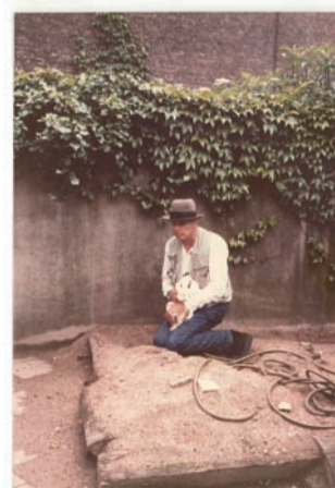
ヨーゼフ・ボイスによる パフォーマンス ワタリのためのアクション 「いつも月に卵がいる日本に」 1981