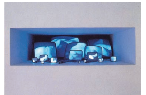
ゲアリー・ヒル つねに、もう、事は始まっているのだから 1990