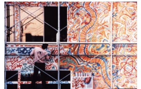
ワタリウム美術館の向かい側にあった建物に 壁画を制作中のキース・ヘリング 1983