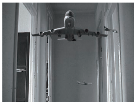
さわひらき Dwelling 2002