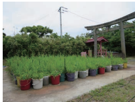
ロイス・ワインバーガー ガーデン 2019 石巻市網島