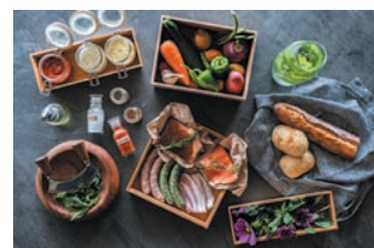
特別 BBQ ランチ

クルックフィールズ 参加 申込書 申込〆切: 5月27日(金)定員になり次第〆切らせていただきます。