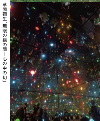
草間彌生「無限の鏡の間―心の中の幻」 ☆国内で唯一常設展示されている作品です。