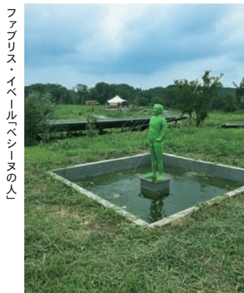
ファブリス・イベルベシーヌの人