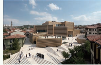
町のシンボルとなったOMM