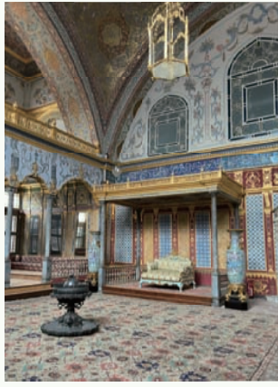
トプカプ宮殿 ハレム スルタンの広間