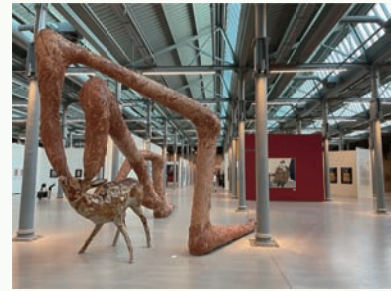
フェスハーネ 展示風景