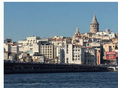
ガラタ橋から見るガラタ塔

ご旅行条件(要旨) このパンフレットは、旅行業法第12条の4に定める取引条件説明書及び同法第12条の5に定める契約書面の一部となります。別途交付する募集型企画旅行条件書海外をお受け取りの上、必ずご確認ください。