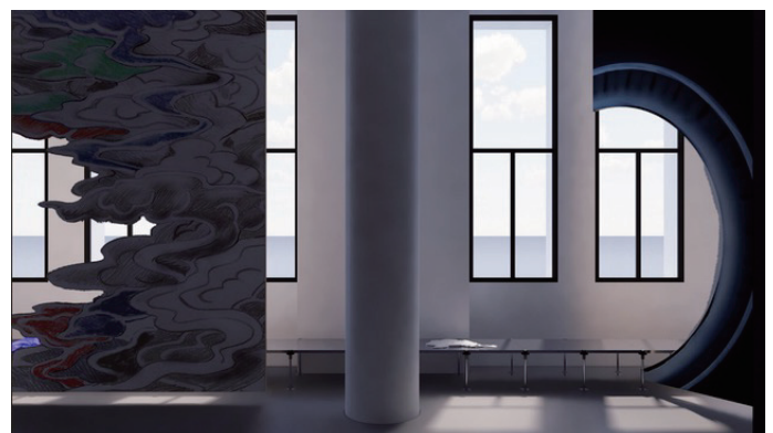
Rockbund Art Museum（上海）