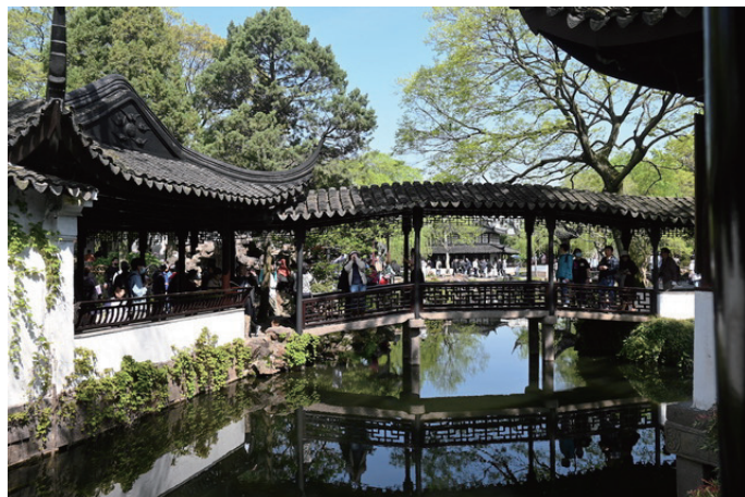
拙政園（蘇州・古典園林）