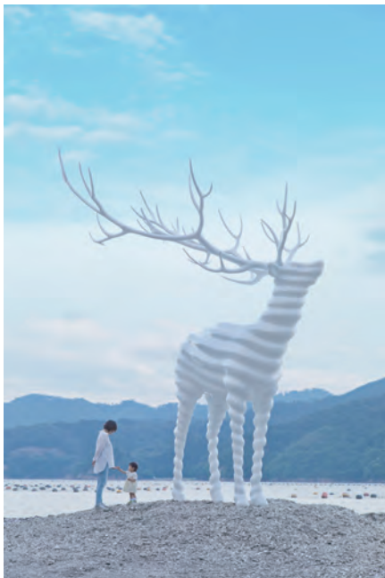
名和晃平 White Deer (Oshika), 2017

※ 本ツアーの見学地には、エリアA(観慶丸を除く)、エリアBが含まれておりませんのでご注意ください。